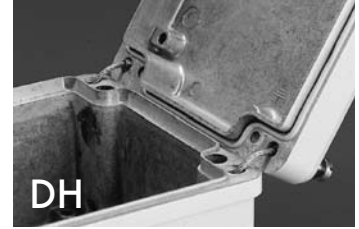
DH Deckelhalter Lidholders Supports de couvercle