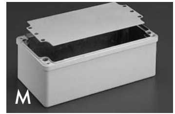
M Montageplatten Mounting plate Plaques de montage