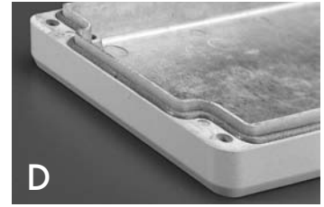
D Silikon-Deckeldichtung Silicon gasket Garniture couvercle en silicone