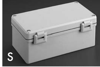
S Scharniere Hinges Charnières