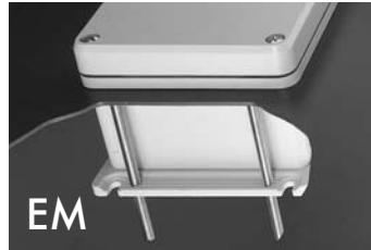
EM Einbaumontagesatz Installation set Jeu de montage